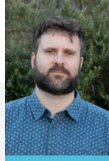
Pau 41 anys Administratiu